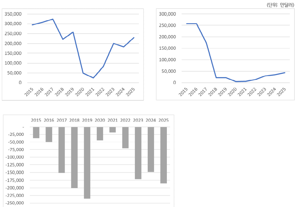
[그림 1] 대중 수입(좌), 대중 수출(우), 대중 상품수지(아래)

어려운 규모의 무역 적자이다. 북한 당국은 2025년 대러시아 무기 수출, 가상화폐 해킹 등 신규 외화 수입원을 발굴하고, 북한 주민에게 사회적 과제를 부여하여 민간이 보유한 외화를 흡수하는 정책을 펼쳤으며, 코로나19 팬데믹 기간인 2020~22년 동안 대중 수입이 연평균 5억 달러 이하로 유지되면서 상당한 수준의 외화 보유고를 가지고 있는 것으로 추정된다. 이 재원을 활용하여 2023~25년 동안 상당한 규모의 무역 적자를 감당한 것으로 판단된다. 그러나 북한경제 규모를 고려할 때 2025년의 상품수지 적자는 북한 GDP(한화 35~45조 원)의 6~8% 수준에 달하는 것으로 경제에 부담스러운 규모이다. IMF에서는 별다른 이유없이 GDP 대비 무역적자가 5~10%에 이를 경우 경제에 대한 경고 단계로 외부 자본에 지나치게 의존하게 되고 대외충격에 매우 취약하게 된다. 외견상 북한경제는 정상적인 상황이 아닌 것이 된다.